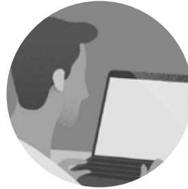
REDACTOR ROCK CONTENT

Este contenido fue traducido por uno de los redactores de la base de Rock Content.