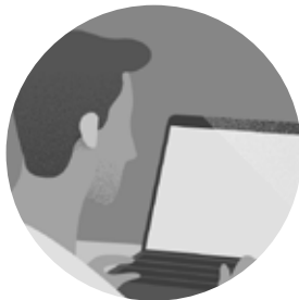
DISEÑADOR ROCK CONTENT

Este contenido fue hecho por uno de los diseñadores de la base de Rock Content.